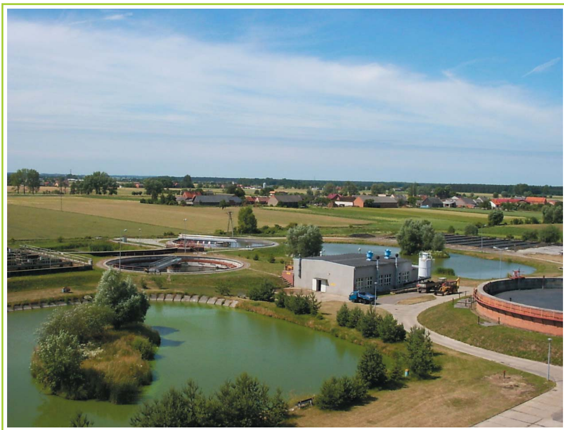
Oczyszczalnia ścieków w Krotoszynie