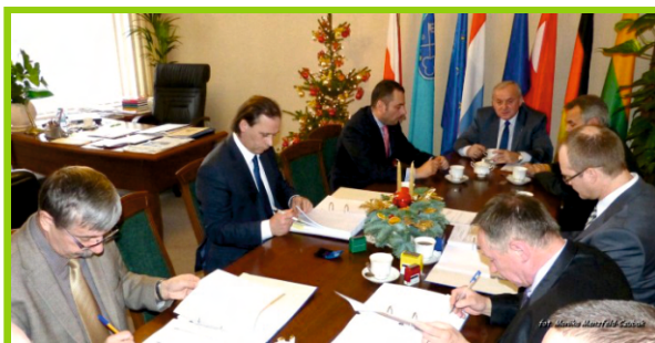
Podpisanie umowy z Wykonawcą robót

Wykonawcą robót było Przedsiębiorstwo Inżynieryjno - Budowlane INFRA sp. z o.o., z Gorzowa Wlkp. Wartość zrealizowanych robót wyniosła: 10.1 mln PLN (netto). Prace trwały od stycznia 2014 r. do końca marca 2015 r.